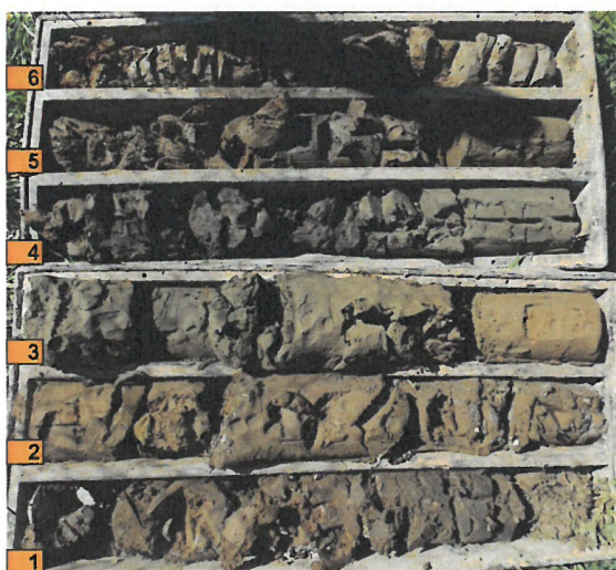
VKM-05 (hĺbka 6 m)