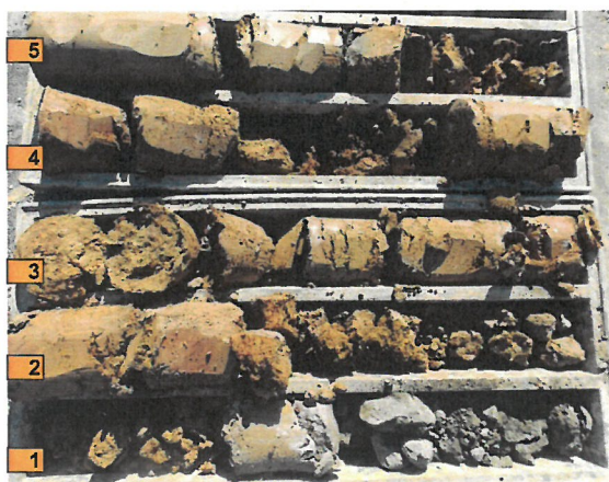
VKC-15 (hĺbka 5 m)