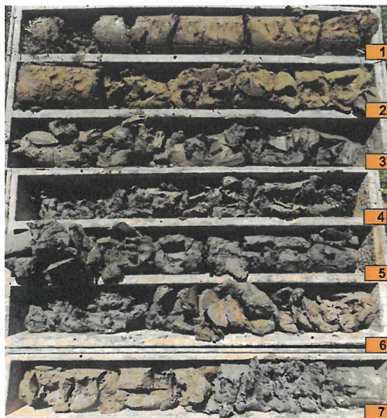
VKM-04 (hĺbka 7 m)