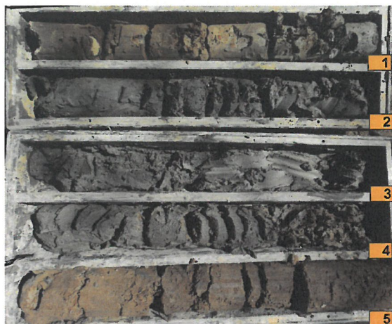
VKM-01 (hĺbka 5 m)